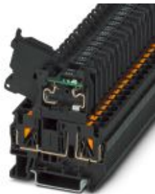
Bloc de jonction porte-fusible à levier, noir, pour cartouches de type G 5 x 20 mm, avec LED pour 24 V AC/DC

Remarque : les données indiquées ici sont tirées du catalogue en ligne. Vous trouverez toutes les informations et données dans la documentation utilisateur. Les conditions générales d'utilisation pour les téléchargements sur Internet sont applicables. ( http://phoenixcontact.fr/download )