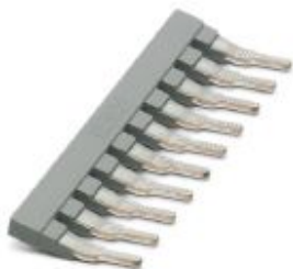
Peigne de liaison, pas: 8 mm, nombre de pôles: 10, coloris: gris

Remarque : les données indiquées ici sont tirées du catalogue en ligne. Vous trouverez toutes les informations et données dans la documentation utilisateur. Les conditions générales d'utilisation pour les téléchargements sur Internet sont applicables. ( http://phoenixcontact.fr/download )