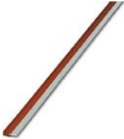
Pont sans fin, longueur: 500 mm, coloris: rouge

Remarque : les données indiquées ici sont tirées du catalogue en ligne. Vous trouverez toutes les informations et données dans la documentation utilisateur. Les conditions générales d'utilisation pour les téléchargements sur Internet sont applicables. ( http://phoenixcontact.fr/download )